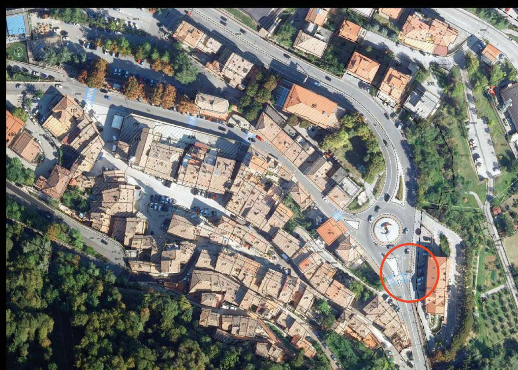
Catasto vigente su aerofotogrammetria 2018-Dipartimento Territorio e Ambiente

L'offesa più grande e irreparabile al Santuario fu quella arrecata dalla guerra. Nella mattinata del 20 settembre 1944 nel corso di un duello di artiglieria, il Santuario fu oggetto di ampio bersaglio e danneggiato gravemente, tanto che in seguito fu completamente demolito. [1]