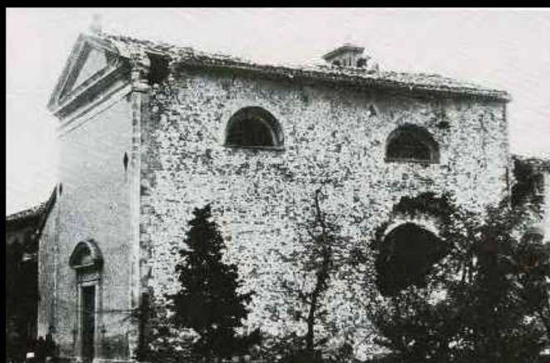
Il Santuario dopo il passaggio del fronte nel 1944 [2]