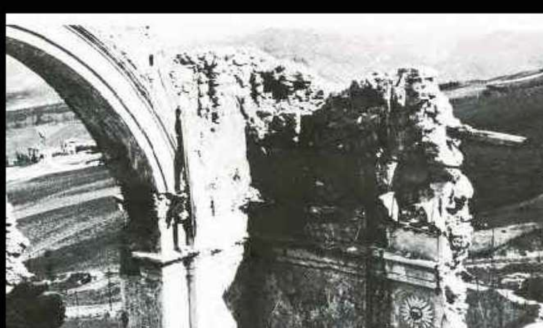
Il Santuario dopo lo smantellamento del tetto [2]