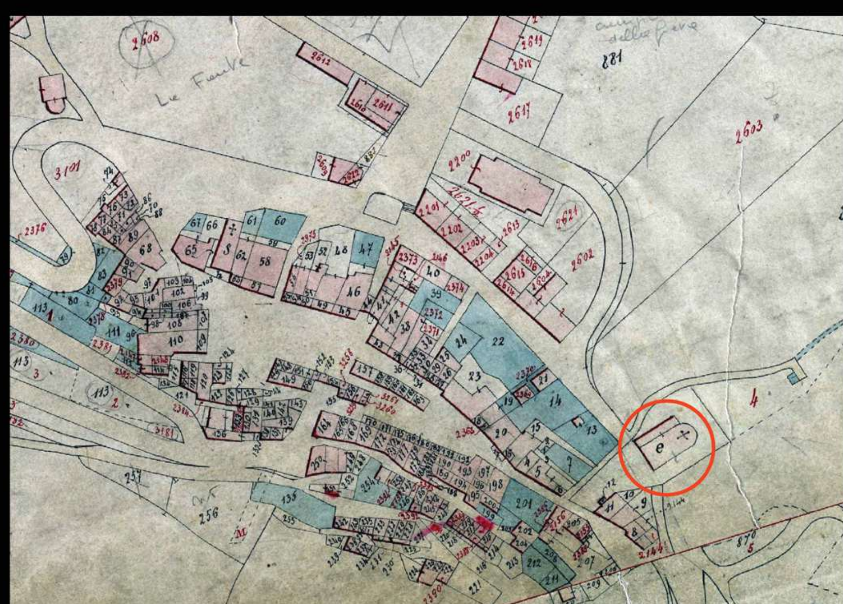
ASSM, Catasto Baronio 1898