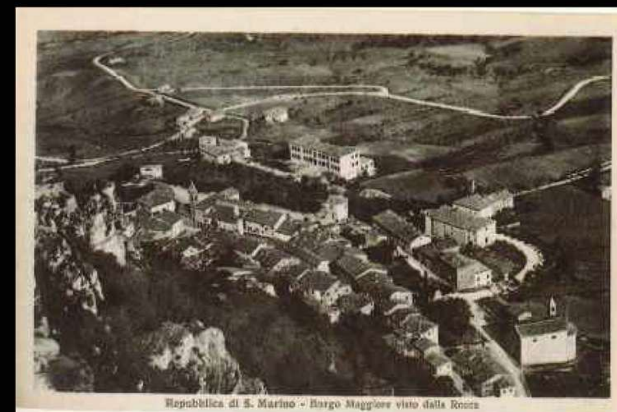
Repubblica di S. Marino - Borgo Maggiore visto dalla Rocca

"Dopo la costruzione della navata laterale, il Santuario ebbe bisogno di quando in quando di qualche lavoro, ma nel 1916 era ridotto in così cattive condizioni statiche che l'Ispettorato Politico, a nome dell'Ufficio Tecnico, ne ordinava la chiusura con nota del 20 agosto del 1916."