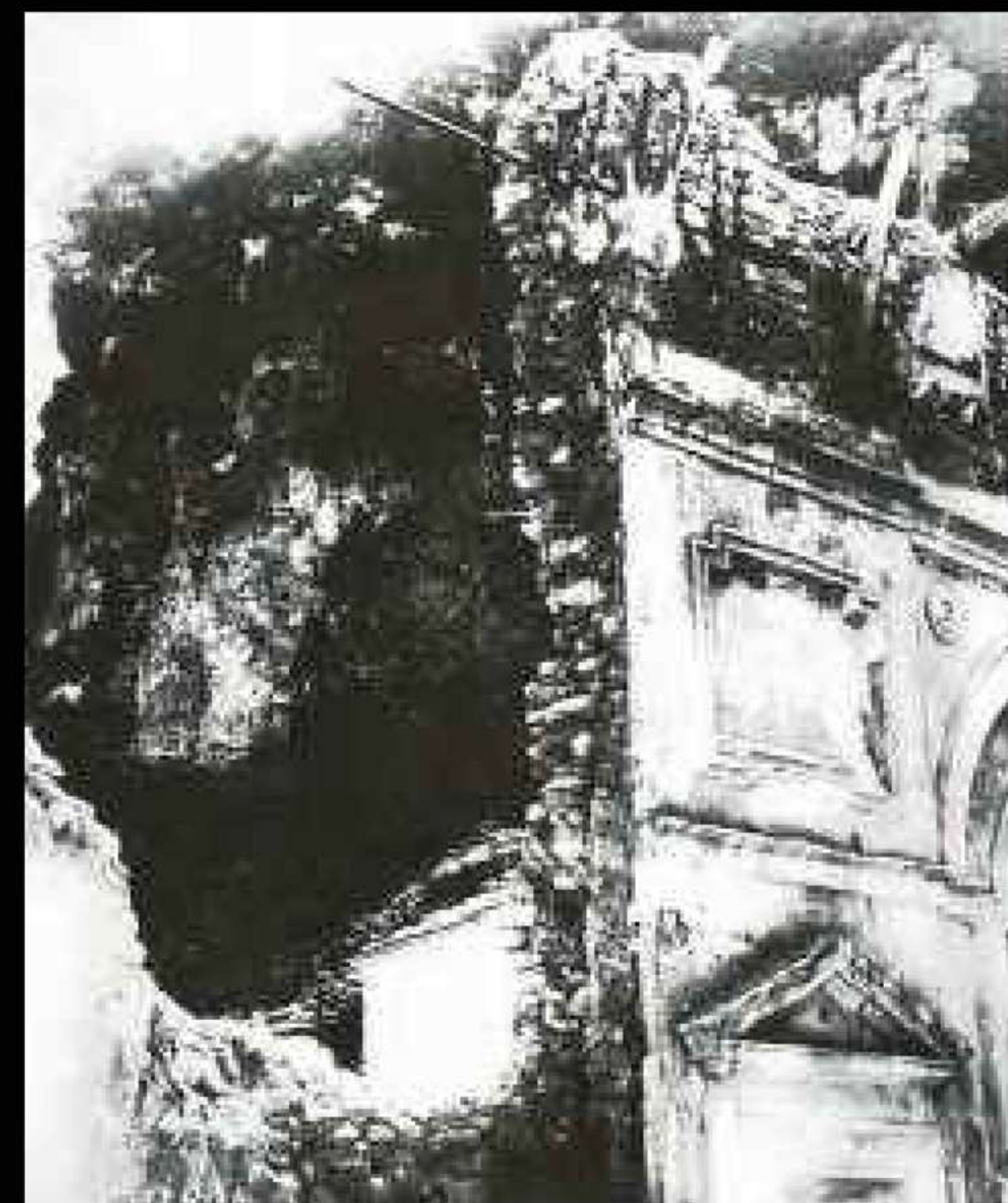
Il Santuario distrutto [2]